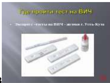
Слайд № 33