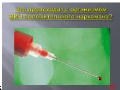
Слайд № 45

Подумай несколько раз, стоит ли терять контроль над своими действиями и какие это может иметь последствия для твоей жизни.