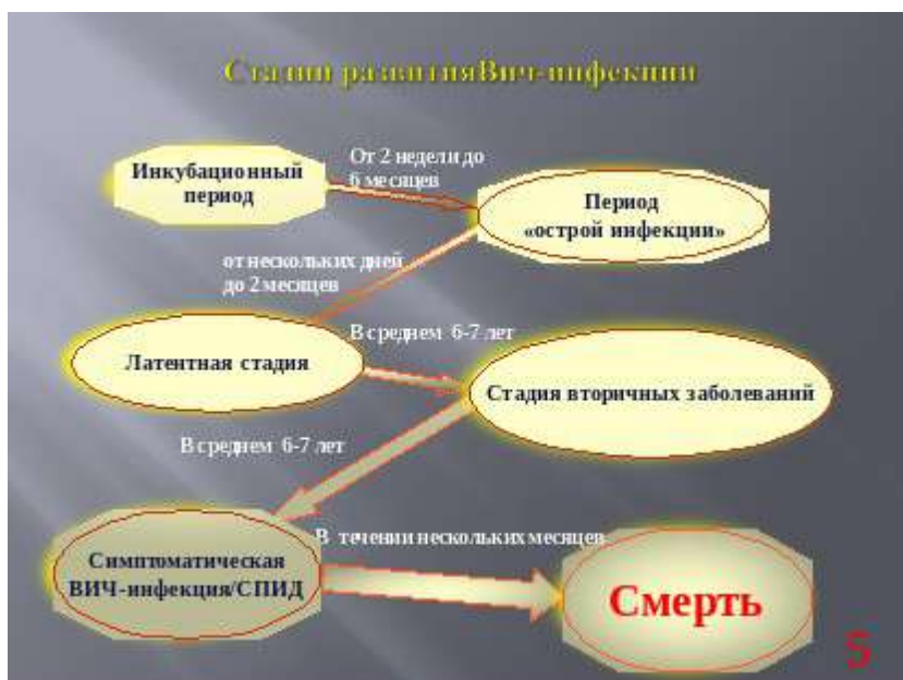
Слайд № 5