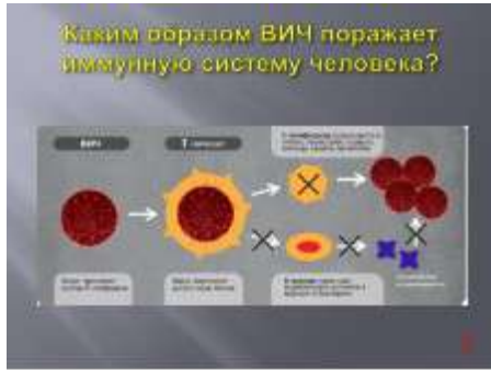
Слайд № 7