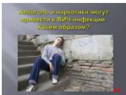
Слайд № 44 (1)

принимать терапию. В этом случае есть шанс жить долго и полноценно, а также родить здорового ребенка.