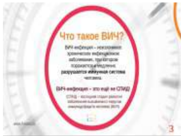
Слайд № 3