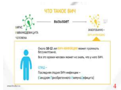
Слайд № 4

ВИЧ и СПИД — не одно и то же. Для вас это новость? Слушайте и будьте в курсе.