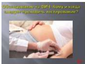
Слайд № 46 (2)