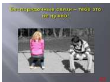
Слайд № 43 (2)