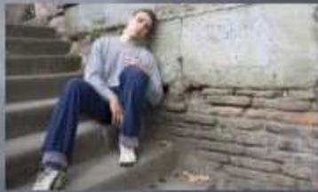
Слайд № 44 (2)

Алкоголь и наркотики могут привести к ВИЧ-инфекции. Каким образом?